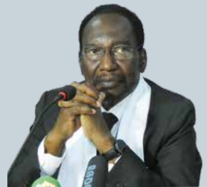
— Dioncounda Traoré

Il Prof. Dioncounda Traoré è stato presidente del Mali dal 2012 al 2013. Dopo aver studiato nell'Unione Sovietica e all'Università di Algeri, è stato professore al Teachers' College ed è stato direttore generale della National School of Engineering. È stato arrestato per le sue attività sindacali e ha partecipato alla lotta per la democrazia che è terminata con la caduta del presidente Moussa Traoré nel 1991. Ha ricoperto l'incarico di ministro della Funzione Pubblica, del Lavoro e della Modernizzazione dell'Amministrazione e di ministro di Stato per la Difesa e gli Affari Esteri. È stato eletto all'Assemblea Nazionale e come presidente dell'Assemblea Nazionale.