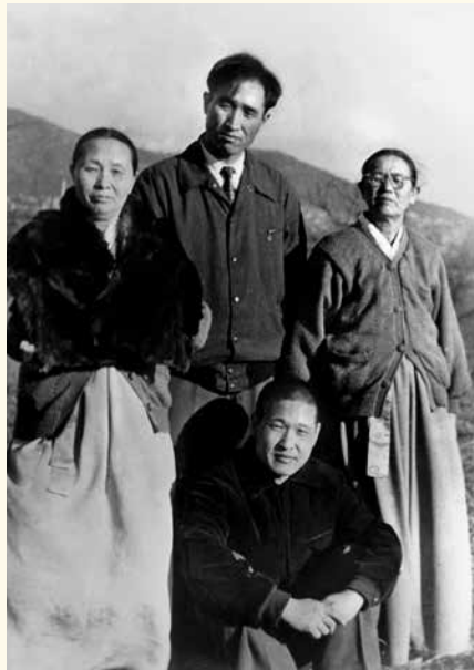
Sun Myung Moon con i primi seguaci a Pyongyang (1947)

La sua esperienza nel campo di morte nordcoreano deve aver cristallizzato persino la fede di Sun Myung Moon nel principio di "vivere per gli altri", poiché gli permise di elevarsi al di sopra del regime disumano in cui si trovava. Forse gli aprì anche gli occhi sulle profondità del male a cui le persone si piegheranno quando motivati da un'ideologia che nega il valore sacro della vita umana: negli anni a venire, Moon avrebbe dedicato notevoli energie e risorse, umane e finanziarie, a creare una controproposta al