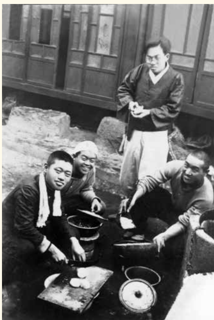
Sun Myung Moon (seduto a destra) da studente a Seoul (fine anni '30), mentre cucina un pasto con gli amici.

Il protestantesimo si era radicato in Corea alla fine del XIX secolo, con profonde radici nella società coreana, specialmente durante il difficile periodo di dominio giapponese. Quando aveva circa dieci anni, la sua famiglia si convertì al cristianesimo. Sembrerebbe che la guarigione spirituale ricevuta dai suoi fratelli maggiori da parte di un guaritore cristiano abbia giocato un ruolo significativo nella conversione della sua famiglia. Moon abbracciò con entusiasmo la sua nuova fede e stabilì un legame personale profondo con Dio, trascorrendo ore a pregare sulle colline locali.