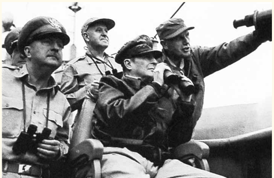
Il generale Douglas MacArthur sulla prima barca diretta a Incheon (15 settembre 1950)

Gran parte della vita successiva di Sun Myung Moon è ben documentata, ma questi anni precedenti rappresentano un esempio straordinario di perseveranza contro ogni probabilità. Offrono preziose lezioni sulla fede e la spiritualità autentica. Moon non solo sopravvisse come un rifugiato privo di risorse in una Corea devastata dalla guerra ma, in mezzo alla distruzione, avviò un movimento per diffondere i suoi principi, aiutare il suo popolo a riprendersi e lavorare per la pace nel mondo.