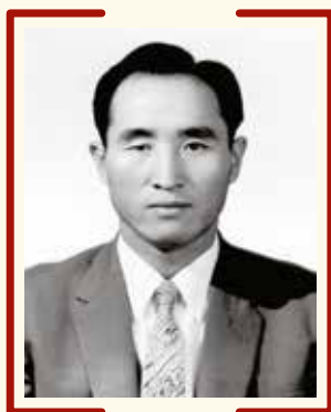
Sun Myung Moon in the 1950s

Tuttavia, la sua giovinezza è stata profondamente influenzata dagli eventi travagliati del XX secolo in Asia orientale, tra cui il lungo dominio straniero, la divisione della Corea durante la Guerra Fredda e la devastante Guerra di Corea. Questi avvenimenti hanno plasmato non solo la sua vita, ma anche la sua motivazione a lavorare per la pace e a ispirare gli altri a scoprire il proprio valore e potenziale divino.