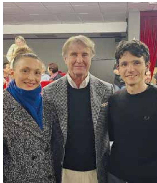
Al centro Brunello Cucinelli

Per qualche ora mi sono ritrovato a pensare che un altro modo di vivere è possibile. Che un altro modo di lavorare è possibile. Che non tutto deve necessariamente passare dall'egoismo, dalla ricerca del proprio tornaconto, dalla logica del "prima io". E questa non è una conclusione teorica, ma una sensazione concreta che mi sono portato fuori dalla sala. Mi ha colpito soprattutto una cosa: il desiderio che è nato dentro di me. Non quello di fare qualcosa di straordinario, ma di fare meglio ciò che già faccio. Di essere più attento, più giusto, più capace di prendermi cura degli altri. È come se, per un momento, si fosse riaccesa una parte di me che nella quotidianità rischia di spegnersi o di essere messa da parte. E qui, forse, sta il punto più profondo di questo docufilm. Non racconta solo una storia, ma propone un modello. Non nel senso di qualcosa da imitare perfettamente, ma come direzione possibile. In un conte-